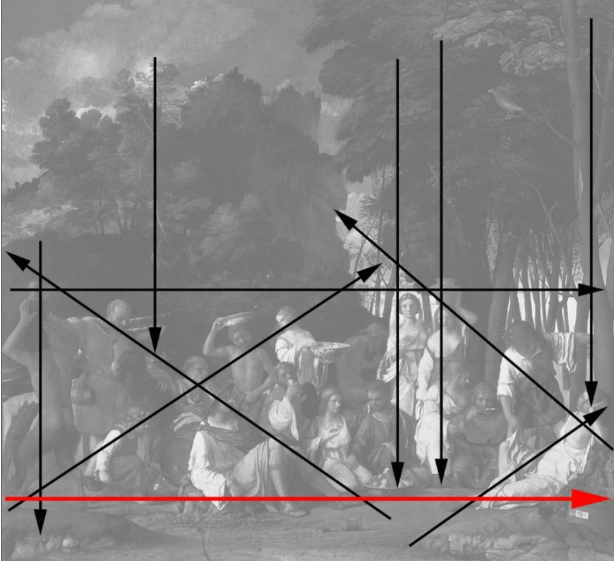
Resim 30: Giovanni Bellini, “ Tanrıların Bayramı ”, tuval üzerine yağlıboya, 170 x 188 cm, 1514